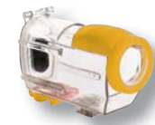
Bogenhalterung ▶ Art.-Nr.: XTA-108