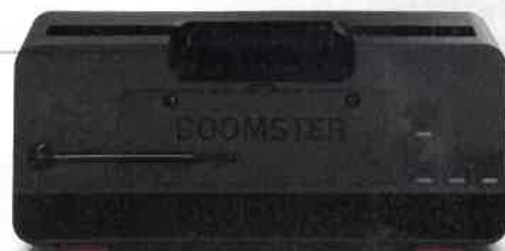
Nicht benötigte Anschlüsse auf der Rückseite sind dank Gummiabdeckung gut versteckt

„Teuflich gut“, so lässt sich der Klang des Teufel Boomster wohl am besten beschreiben. Hinter dem schicken Gitternetz hat der Her-