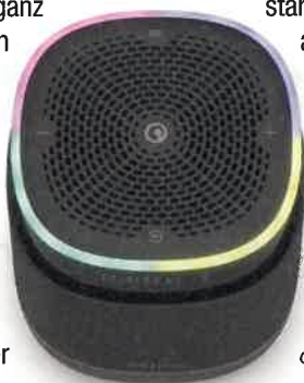
Das Bedienfeld auf der Oberseite beinhaltet einen LED-Farbring, der auch als Bedienfeld dient

Um den Pure StreamR zu starten, genügt ein kräftiger Druck auf der Oberseite. Dann wird der