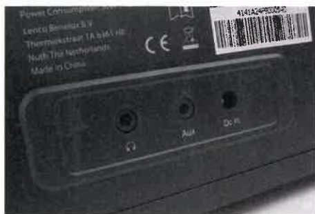
Das Lenco erlaubt den Direktanschluss von Zuspieldern über Miniklinke

Klanglich überzeugt das Lenco DIR-260 mit gleich zwei eingebauten Lautsprechern, die es gemeinsam auf eine Ausgangsleistung von 20 Watt bringen. Diese werden rückseitig von zwei Bassreflexöffnungen klanglich unterstützt. Für den individuellen Hörgenuss kann