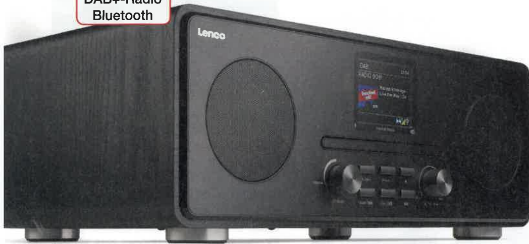
DAB+/Internetradio mit CD-Player und Bluetooth: Lenco DIR-260