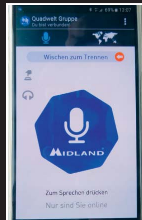
App dafür: Mit dem kostenlosen Programm lassen sich ganz viele Teilnehmer zur Besprechung verbinden.

Voraussetzung für eine reibungslose Kommunikation ist natürlich eine entsprechende Ausstattung unterm Helm, sprich Lautsprecher und ein Mikrofon. Tatsächlich reicht da schon ein Headset, das heute vielen Smartphones schon als Zubehör beiliegt. Komfortabler ist da aber eine Nachrüstung in Form eines kabelgebundenen Stereoheadsets wie das von Alan Electronics angebotene Modell SHS 300i (34,90 Euro), das sich grundsätzlich in jeden Helm einbauen