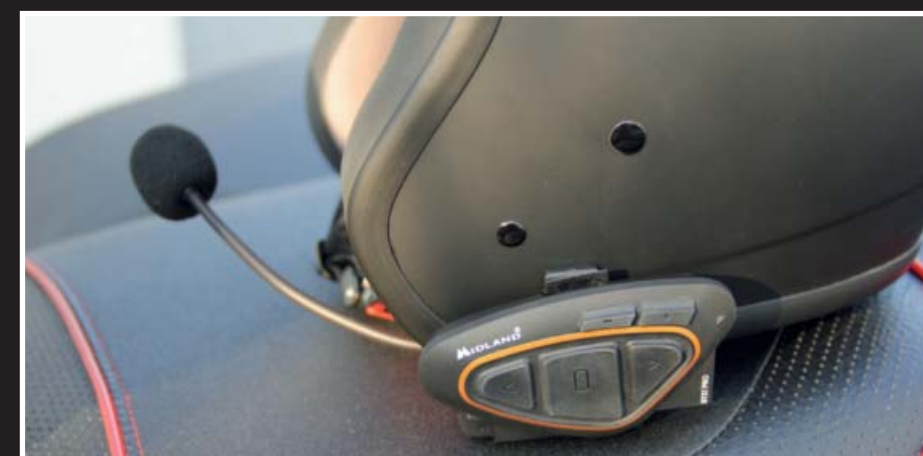
Up to Date: Die Gegensprechanlage BTX1 Pro als Twin-Set ist auf dem aktuellen Stand der Technik.

lässt. Vielleicht etwas klobig und viel Kabelgedöns, dafür sehr preiswert und robust. Wesentlich angenehmer, da kleiner und im Helm fast unsichtbar unterzubringen ist eines der neuen Bluetooth-Helmsets aus dem Midland-Programm. Wir probieren das Advanced Intercom System BTX1 Pro, das gleich als Twin-Set zwei Helme mit der neuesten Kommunikationstechnik ausrüstet. Die Anlage wird in einer feinen Reisetasche geliefert, die auch härteren Trips standhalten sollte. Ausgerüstet mit der aktuellsten Bluetooth Technologie 4.2 erfüllt die Gegensprechanlage hohe Ansprüche an Funktionalität und Ausstattung. Das Set ist ideal für Fahrer und Beifahrer, oder auch kleinere Gruppen, die ge-