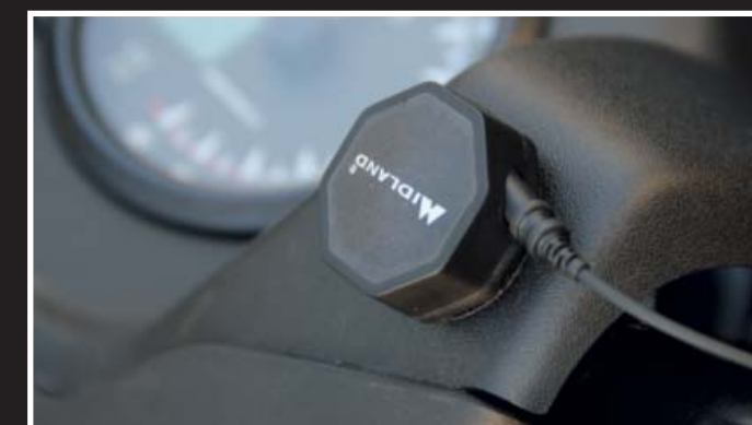
Zwei in Eins: Das Sendeteil der BTTalk Taste reagiert ebenfalls auf Knopfdruck.