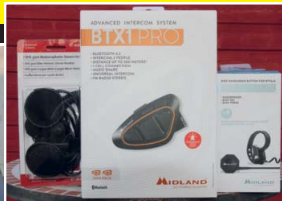
Portfolio: Eine kleine Auswahl der Alan Electronics Produkte, die wir ausprobieren dürfen.

und dabei auch für große Gruppen zur Kommunikation geeignet ist. Die Bedienung erfolgt dabei über einen Talk-Button, der sich ebenfalls per Bluetooth mit dem System verbindet und damit eine sichere Handhabung während der Fahrt garantiert.