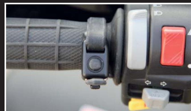
Kleiner Knopf, große Wirkung: Mit der neuen BTTalk Taste lässt sich locker plaudern.

zum Beispiel Bluetooth-Lautsprecher, sowie die modernen Bluetooth-Kommunikationssysteme für Helmträger und vielseitiges Zubehör, das ständig weiterentwickelt wird und sich den Kundenwünschen anpasst. Auch im Bereich der Entwicklung von Apps fürs Handy ist Alan Electronics tätig. Wir haben uns aus dem Angebot einmal ein aktuelles Modell für die interne Kommunikation zum Test geordert, das sich per Bluetooth-App mit dem Handy verbindet